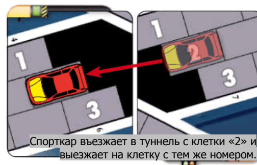
Спорткар въезжает в туннель с клетки «1» и выезжает на клетку с тем же номером.

Участок дороги в туннеле не просматривается. Если спорткар въезжает в туннель с клетки с номером «1», при выезде из туннеля он просто ставится на клетку с тем же номером и т.д.